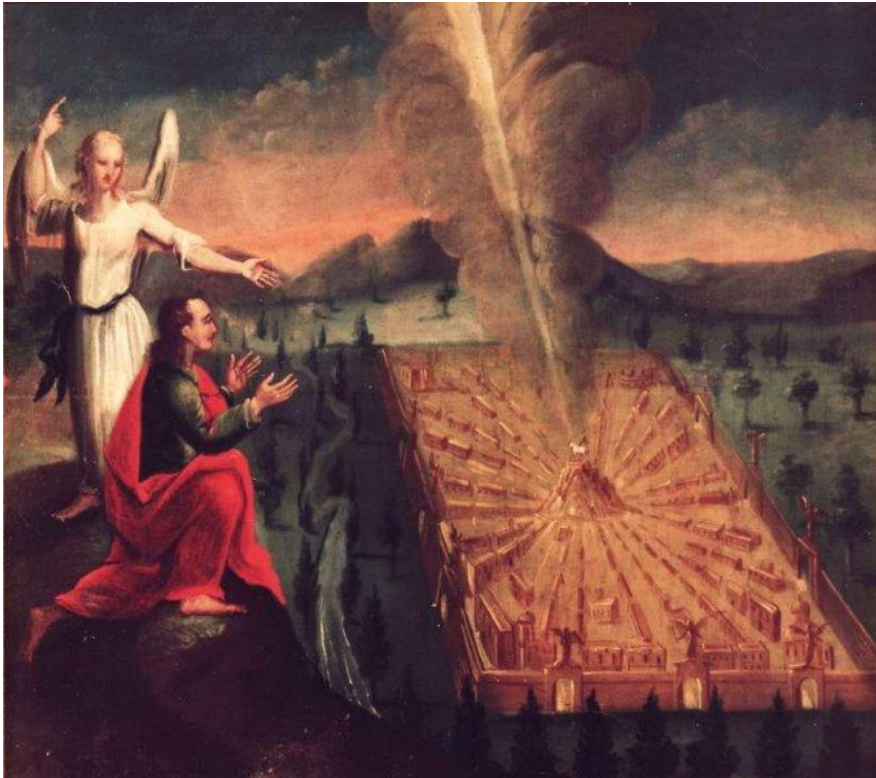
27 Das neue Jerusalem (Offb 21)

Die Bilder waren ursprünglich im Kirchenraum verteilt und wurden erst später beim Einbau der Empore angebracht. Dabei wurden vermutlich die beiden letzten Bilder vertauscht.