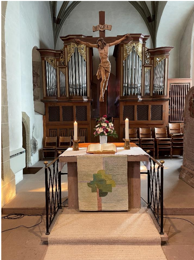
(Chor der Oswaldkirche mit Orgel)

Das Instrument wurde 1761/62 vom Orgelbaumeister Johann Sigmund Haußdörfer aus Tübingen gebaut. Sie zeigt einen holzgeschnitzten, vergoldeten Prospekt. Die Empore im Chorraum, auf der die Orgel ursprünglich stand, wurde 1937 abgebrochen. Die Firma Link baute eine neue Orgel an heutiger Stelle ein, wobei das Gehäuse und ein kleiner Teil der Pfeifen aus der alten Orgel wiederverwendet wurden.