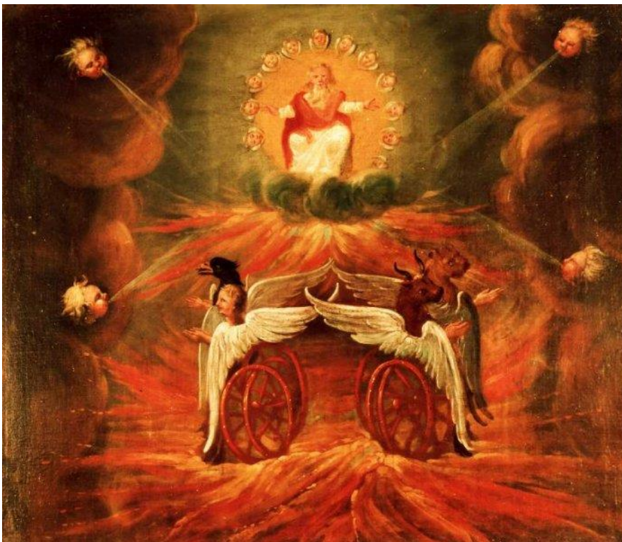
10 Ezechiels Vision von der Herrlichkeit Gottes (Ez 1)