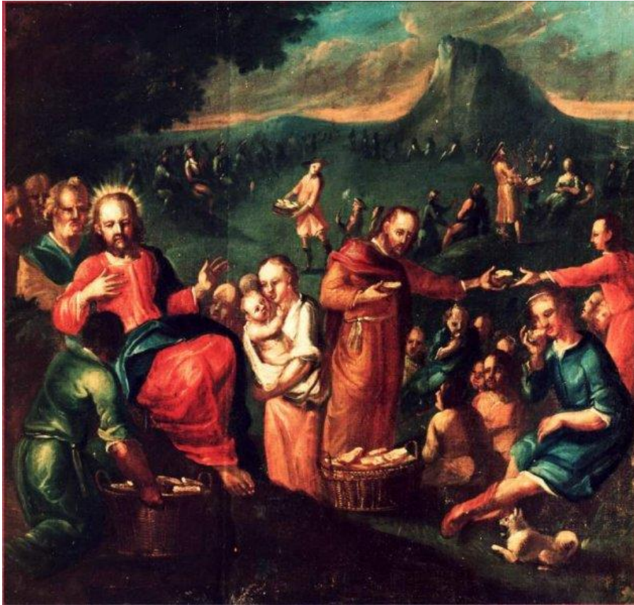
15 Die Speisung der Fünftausend (Joh 6,1-15)