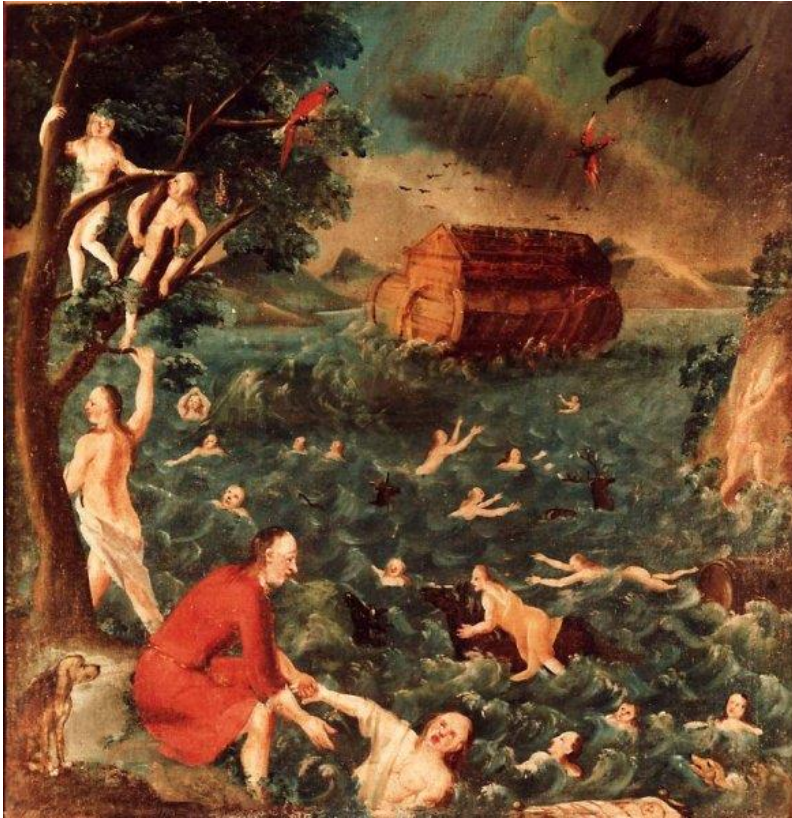
3 Die Sintflut (Gen 7)