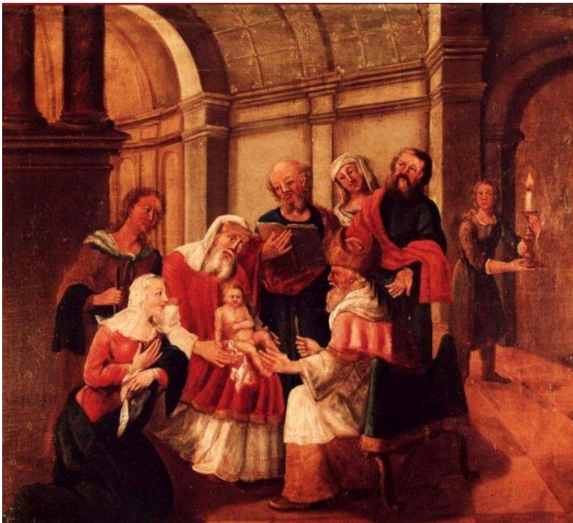
12 Jesus wird beschnitten (Lk 2,21-38)