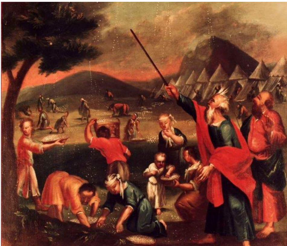
6 Der Auszug aus Ägypten (Ex 16)