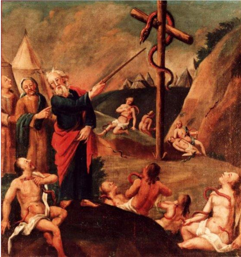
9 Die Schlange in der Wüste weist auf das Kreuz hin (Num 21)