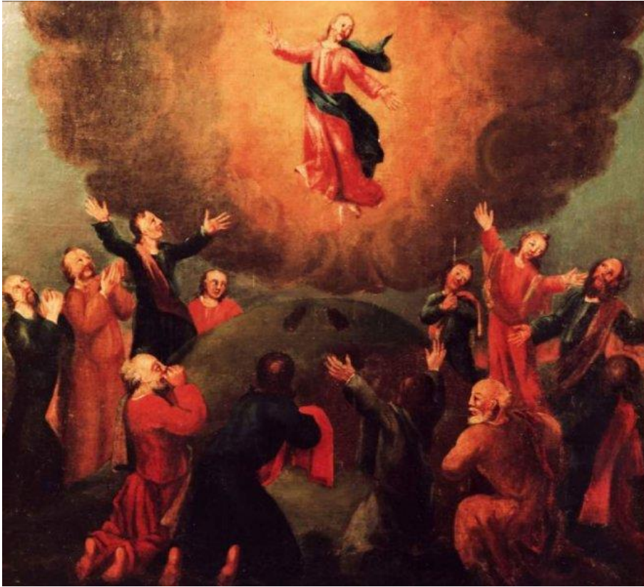
23 Die Himmelfahrt Jesu Christi (Apg 1,4-9)