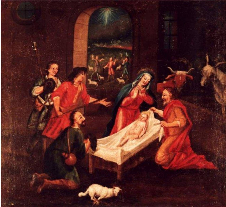
11 Krippenszene: Jesus wird geboren (Lk 2,8-20)