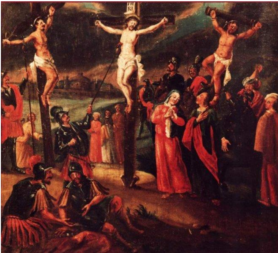
20 Die Kreuzigung Jesu (Mt 27,37-50)