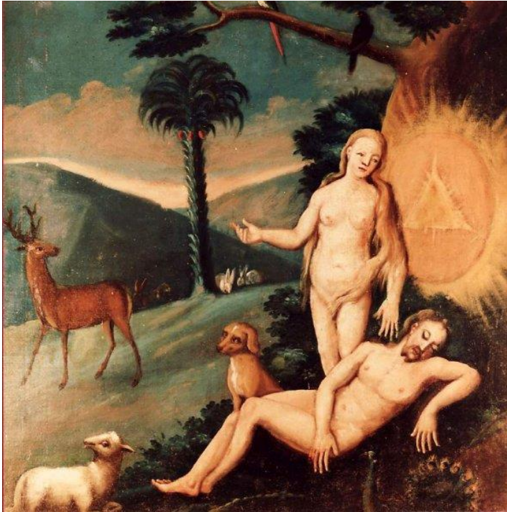
1 Der Mensch im geschaffenen Paradies (Gen 2 und 3)