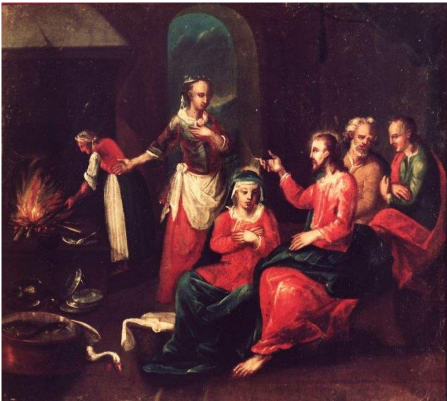
16 Maria und Marta (Lk 10,38-42)