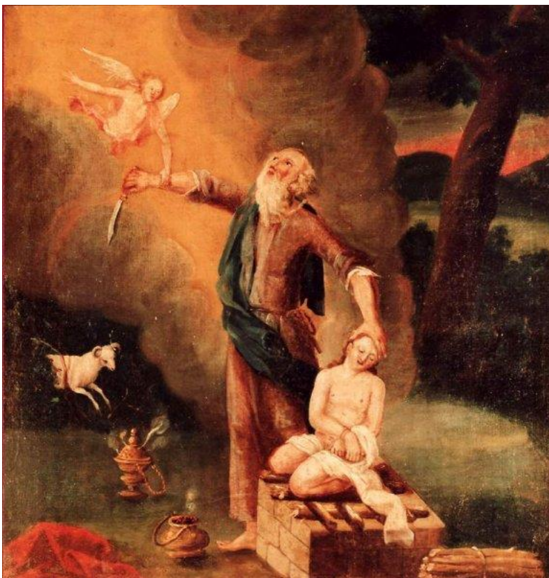
4 Die Bindung Isaaks (Gen 22)