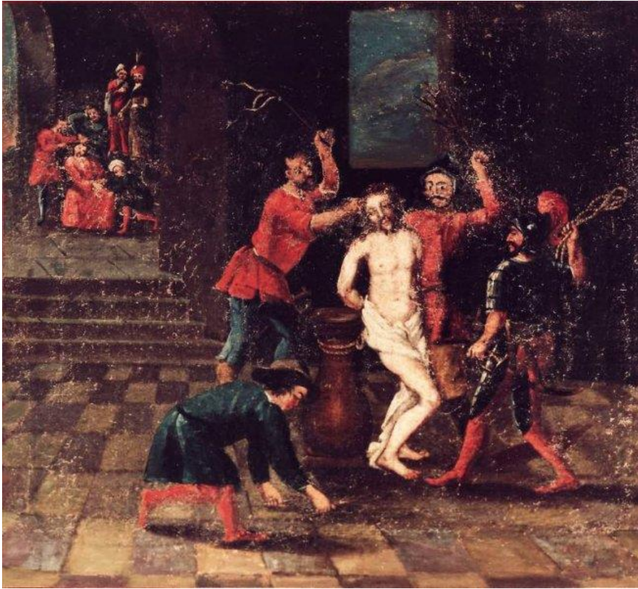
19 Jesus wird verurteilt und verspottet (Mt 27,27-30)