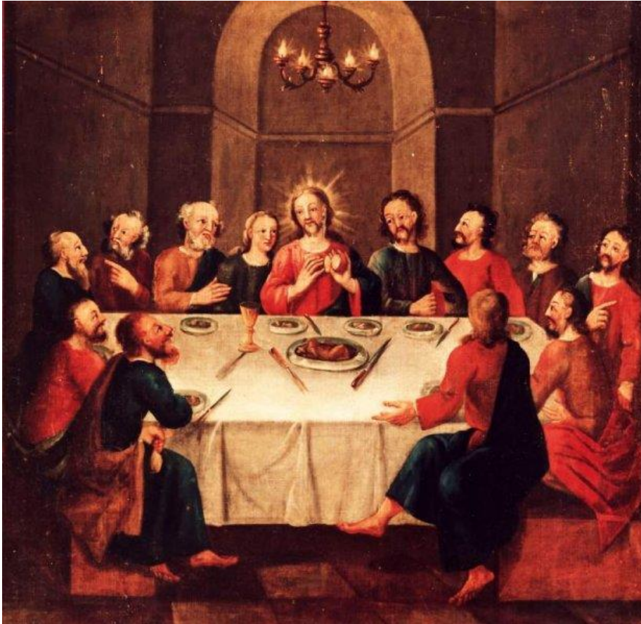
17 Jesus Christus setzt das Heilige Abendmahl ein (Mt 26,20-29)