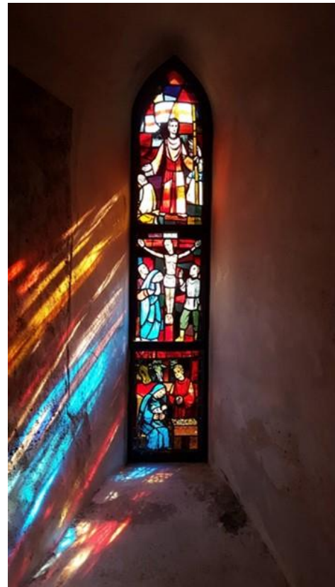
(Fenster­nische im Chor)

1954 wurde die Orgel durch die Firma Weigle erneuert und dabei von 15 Registern (970 Pfeifen) auf 21 Register (1300 Pfeifen) erweitert. Hierbei wurde auch eine elektrische Registertraktur mit drei freien Kombinationen eingebaut.