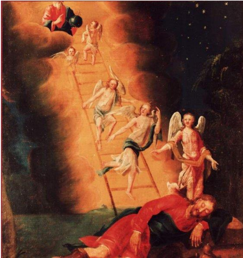
5 Jakobs Traum von der Himmelsleiter (Gen 28)