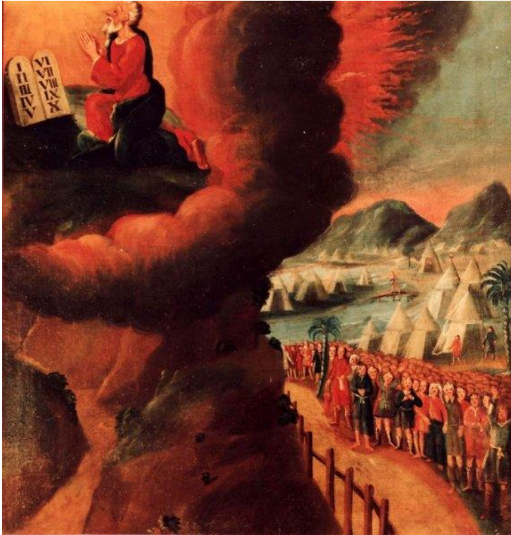
7 Mose empfängt die Zehn Gebote (Ex 19-21)