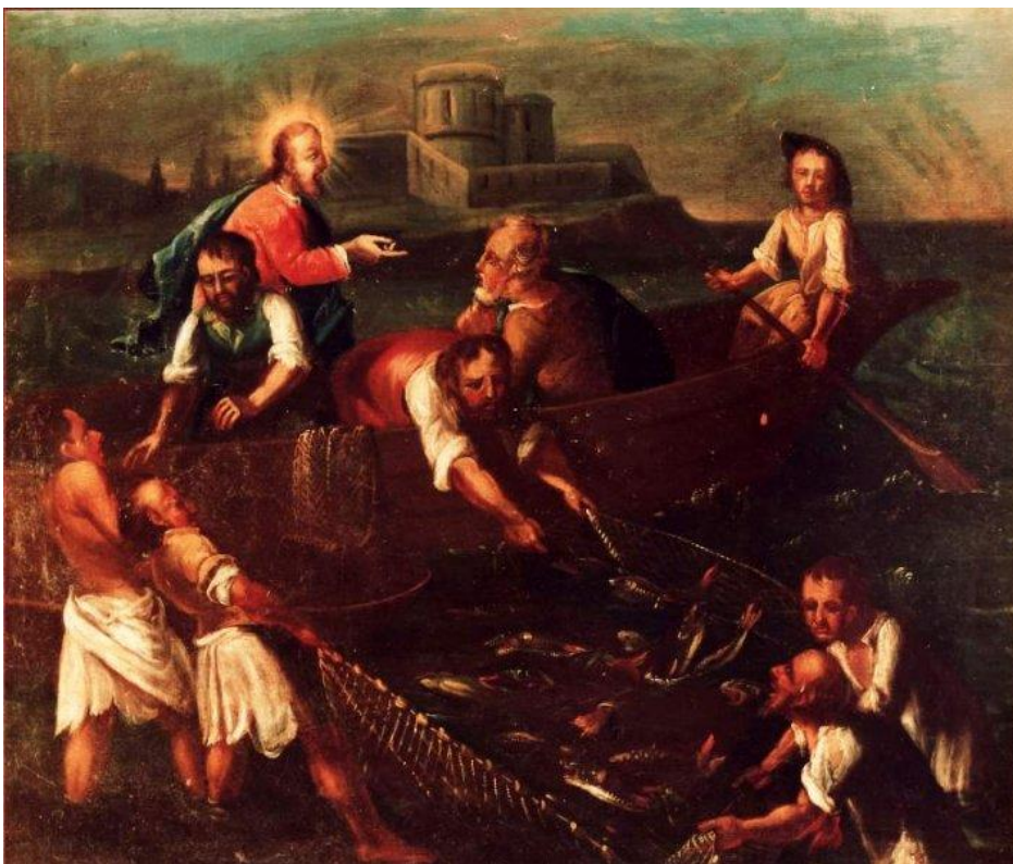
14 Der Fischzug des Petrus (Lk 5,1-11)