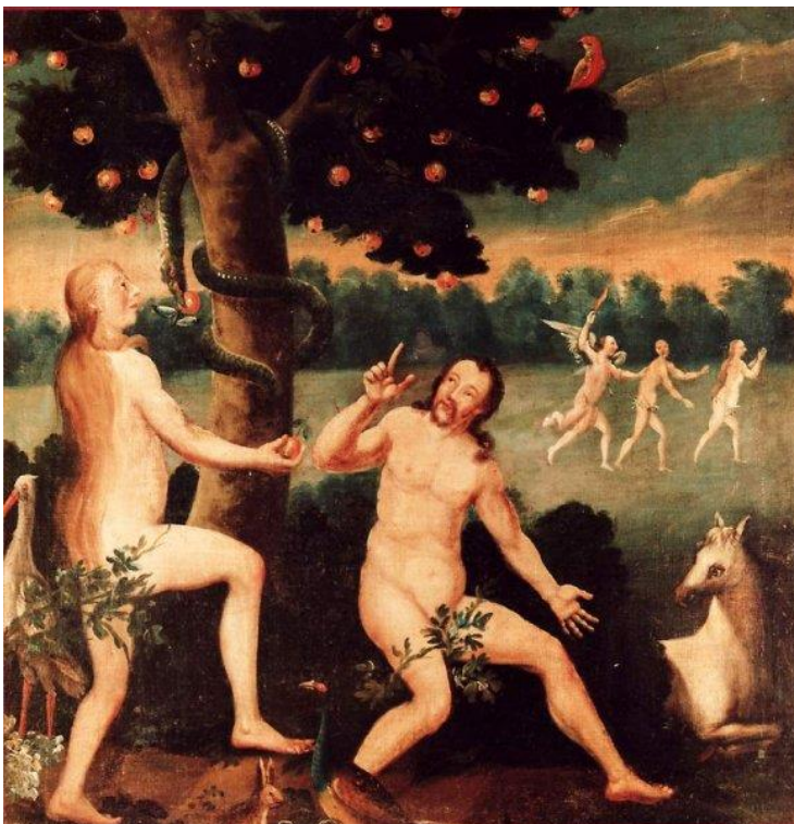
2 Der Sündenfall (Gen 3)