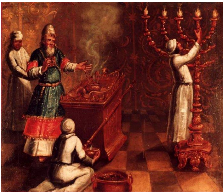
8 Das Heiligtum (Ex 25)