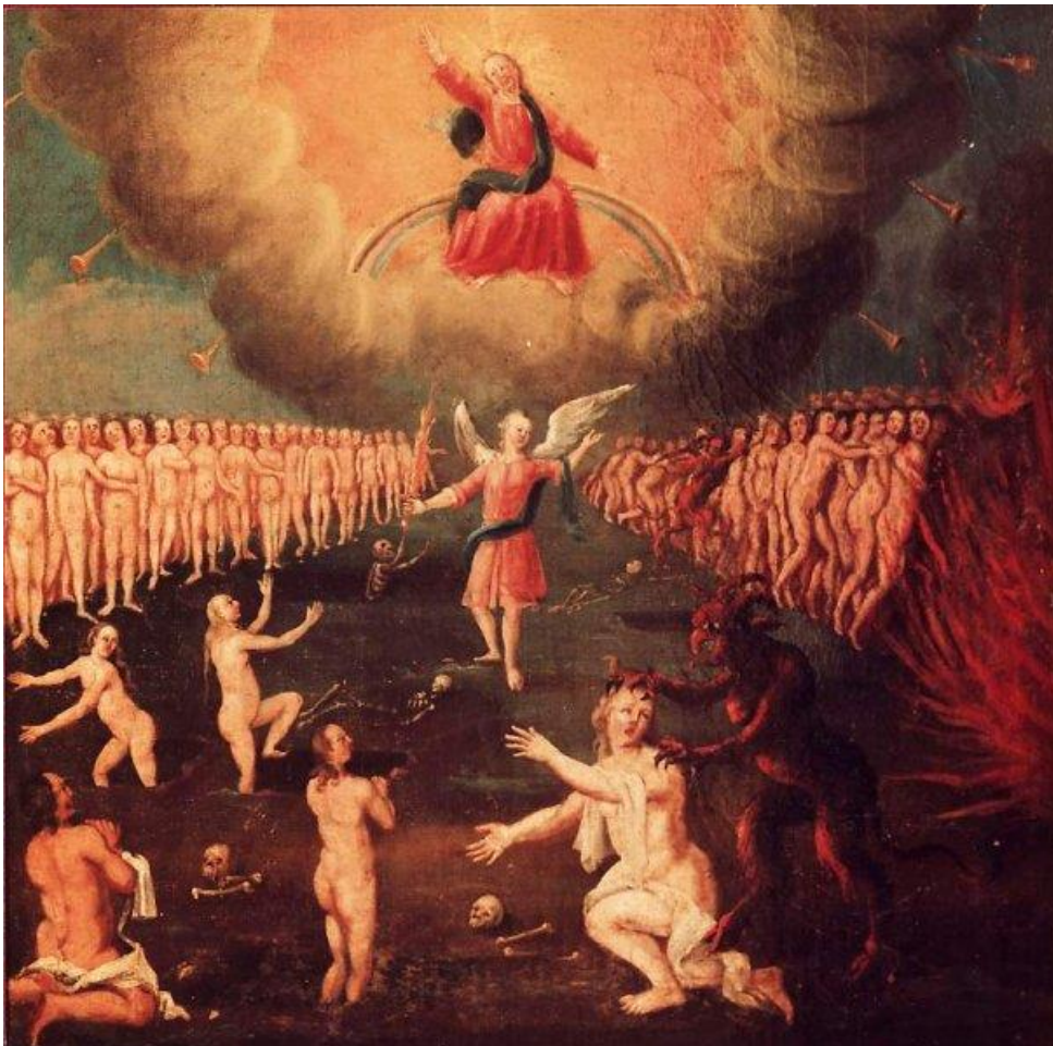
26 Die Wiederkunft Christi und das Jüngste Gericht (Offb 20,11-15)