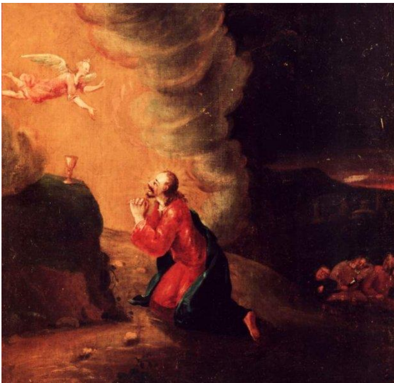
18 Jesus in Gethsemane (Mt 26,36-46)