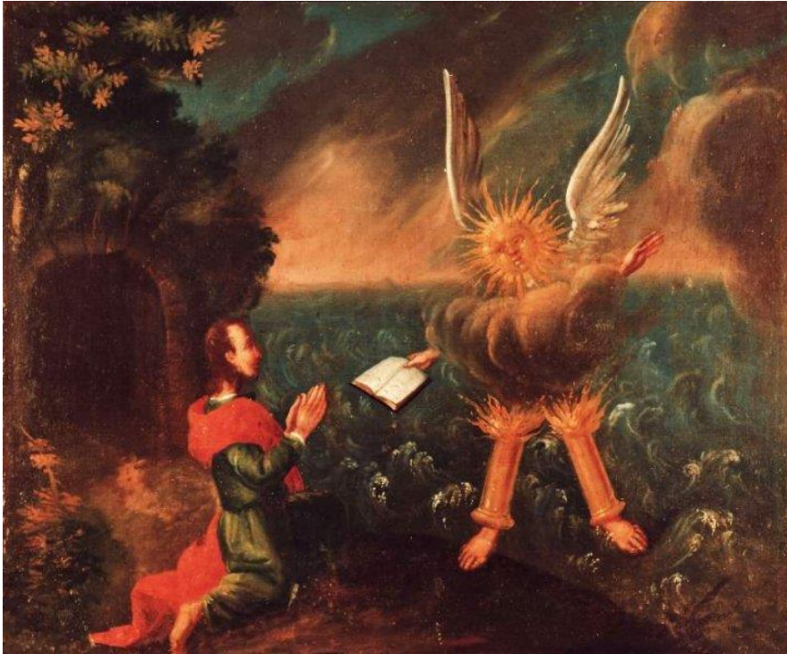
25 Der Engel mit dem Büchlein (Offb 10)