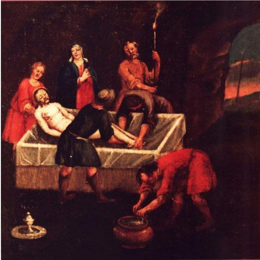
21 Die Grablegung Jesu (Joh 19,38-42)