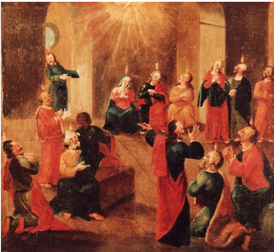
24 Das Pfingstwunder (Apg 2,1-4)